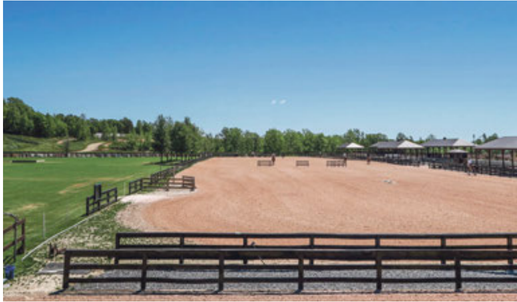
Den Reitern stehen verschiedene Abreitplätze zur Verfügung.

ursprünglich vorgesehenen kanadischen Bromont wurden die Spiele erst vor einem Jahr entzogen –, steht jetzt das Organisationskomitee, und die Organisation scheint auch voranzukommen. «Die Anlage sieht wirklich sehr gut aus. Eine bestehende grosse Grasarena wird noch in Sand umgewandelt, die Indoorarena muss fertiggestellt und am Cross-Country-Gelände – welches gleichzeitig auch als Basis für Endurance dient – sowie den Fahrsporthinstallationen muss noch gearbeitet werden, der Rest ist bereits vorhanden und in gutem Zustand», bestätigt Evelyne Niklaus.