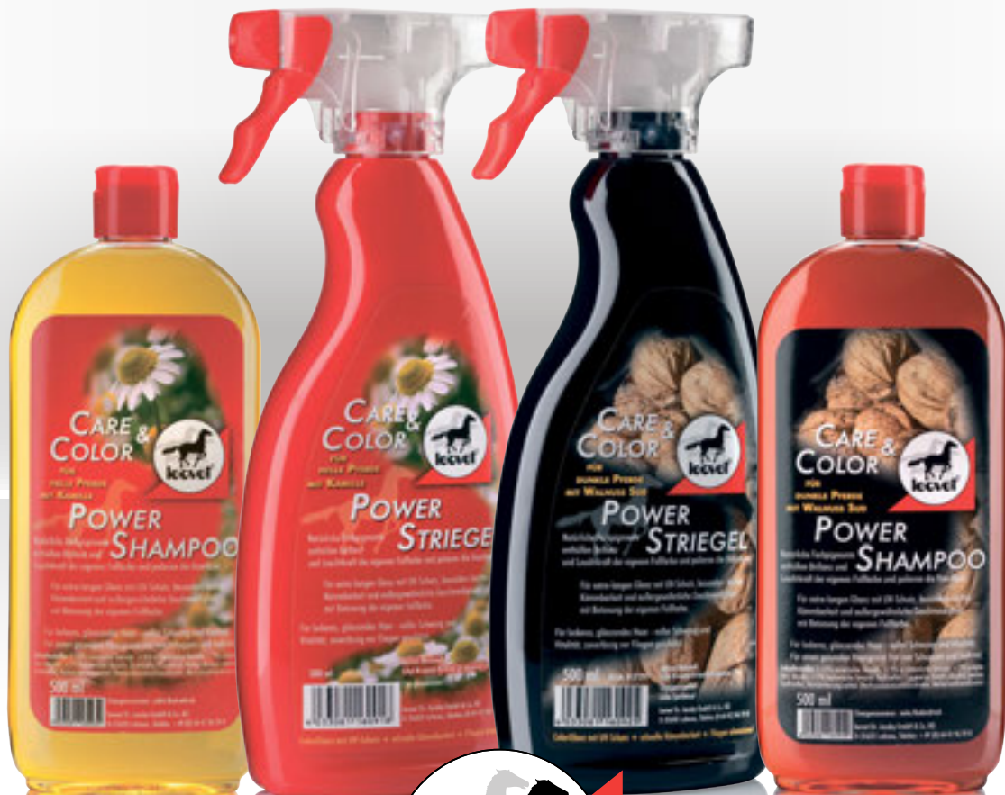
Für helle Pferde mit Kamille.

Für einen besonders glänzenden Auftritt könnt ihr den Power Striegel auf eine weiche Bürste sprühen und dann damit das Fell bürsten. Das Fell wird dadurch super weich und glänzend. Dabei eignet sich der Power Striegel Walnuss besonders für dunkle Pferde, der Power Striegel Kamille besonders für hellere Pferde. Somit könnt ihr für jeden Haartyp einen besonderen Schimmer und Glanz auf Schweif, Mähne und Fell zaubern.