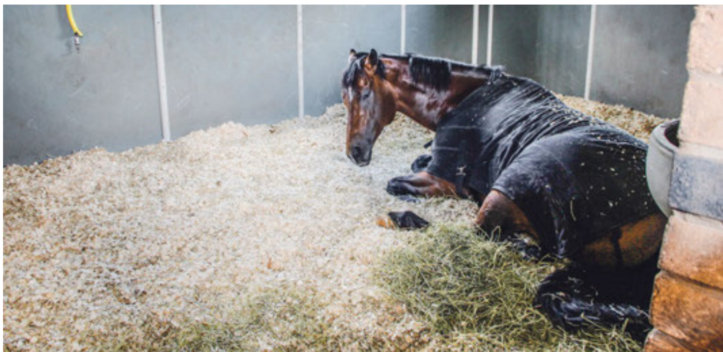
Les copeaux, les pellets de paille ou la paille longue n'ont pas une importance déterminante sur la durée de la position couchée par nuit.

La capacité d'absorption, les habitudes alimentaires du cheval, la quantité de fumier et le travail engendrés sont les propriétés qui ont été identifiées comme des critères de décision lors du choix de litière pour la détention de chevaux dans une analyse de marché de la HAFL. Celle-ci a ensuite évalué les différents matériaux de litière dans une étude afin de déterminer de manière objective les différences en fonction de critères mentionnés ci-dessus et des habitudes de repos du cheval. Les granulés de paille, les copeaux de bois et la paille longue ont été testés lors d'un essai pratique de six semaines effectué dans une écurie de cinq chevaux détenus en box. La capacité d'absorption (quantité d'eau absorbée en grammes après 2 et 24 heures) de 30 produits de litière différents a de plus été testée séparément dans des conditions standardisées de laboratoire.