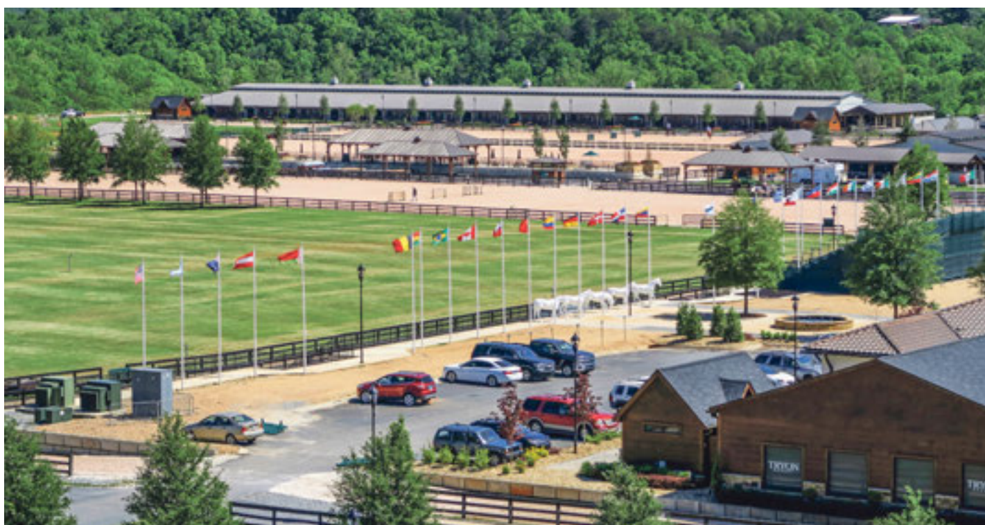
Les installations du TIEC vues du ciel.