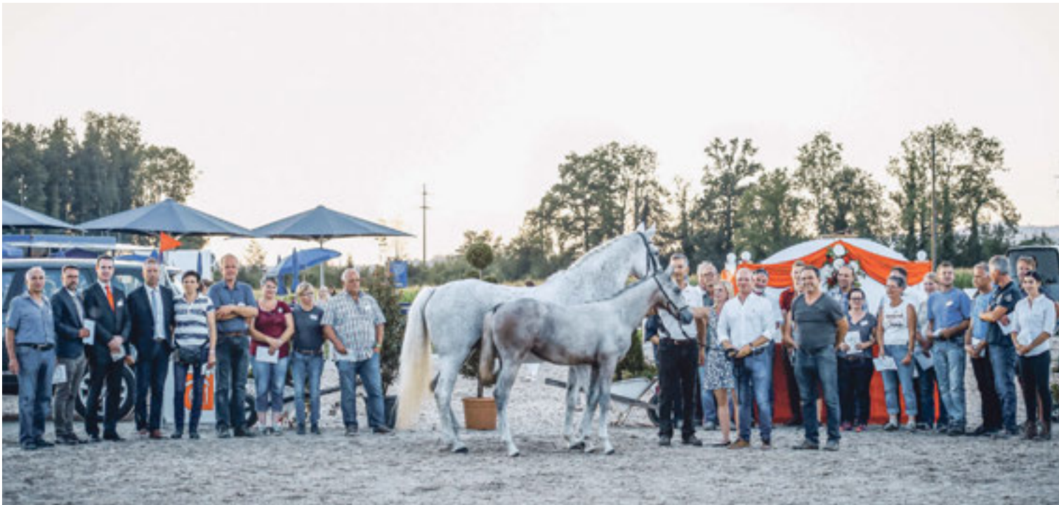
Le poulain Zira Blue ZSH.