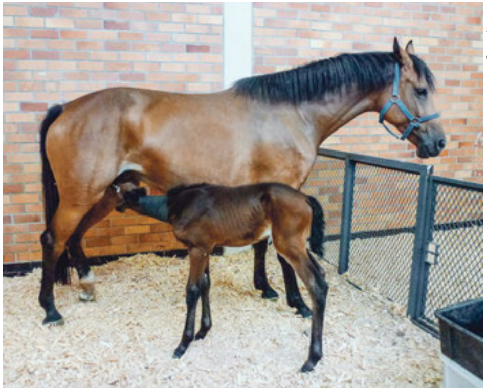
Hobelspäne Einstreu in einer Pferdeklinik.

Pferde liegen lieber auf einer trockenen Unterlage, weswegen die Saugfähigkeit von Einstreu ein wichtiges Kriterium ist. Diese wurde unter standardisierten Laborbedingungen gemessen, damit verschiedene Einstreuqualitäten direkt verglichen werden können. Unter den «Top 10» der saugfähigsten Einstreumaterialien sind 7 Strohpelletprodukte, 2 Strohkümmelprodukte und 1 Strohgranulat. Bei den Strohpellets waren kleinere Pellets mit einer insgesamt grösseren Oberfläche saugstärker als grobe Strohpellets, die etwa vergleichbar mit den am besten saugenden Hobelspänen waren. Dinkelkornstreupellets waren das einzige Strohpelletprodukt, das mit 128 g gebundenes H_2O/2 h sogar noch eine tiefere Saugfä-