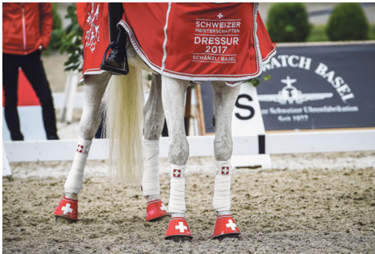
Impression von den Schweizer Meisterschaften Dressur 2017. Impression lors des Championnats Suisses de Dressage 2017.