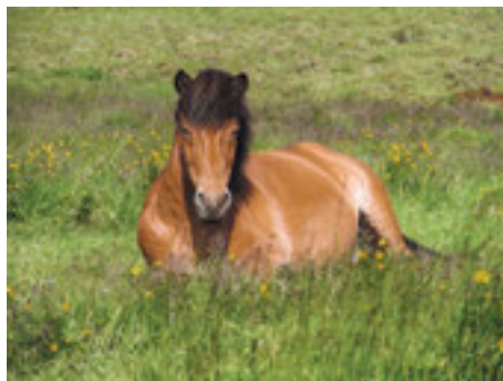
Entspanntes Schlafen ist wichtig für das Wohlbefinden des Pferdes.

Es liess sich feststellen, dass Strohkümmel, Strohpellets, Strohgranulate und Sägemehl im Durchschnitt eine vergleichbare Saugfähigkeit aufwiesen. Einzelne Produkte waren innerhalb der Kategorien dennoch deutlich saugstärker (z.B. verschiedene