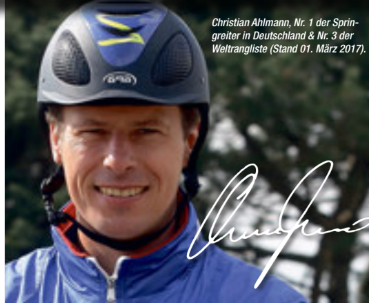
Christian Ahlmann, Nr. 1 der Springreiter in Deutschland & Nr. 3 der Weltrangliste (Stand 01. März 2017).

Christian Ahlmann „Besser geht es nicht!“