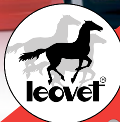
Für dunkle Pferde mit Walnuss.