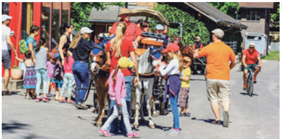
Ein Highlight der Feier: Die Ponykutschen.