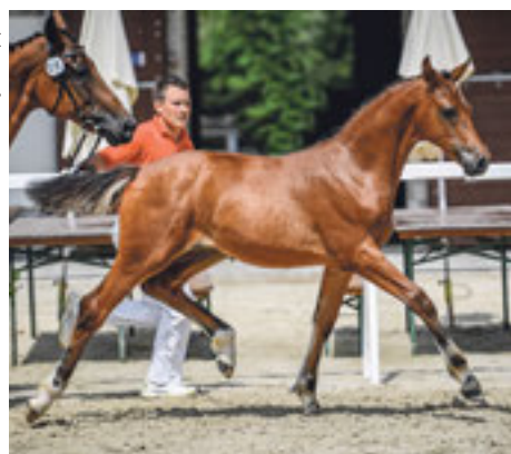
Zwei der Fohlen aus dem erlesenen Angebot.