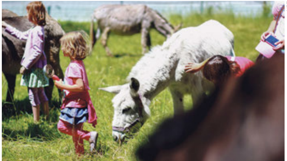
Kinder erfreuen sich an den Eseln.

Das Feedback von aussen ist sehr positiv. Im NPZ gibt es so viele schöne und bewegende Geschichten – wir möchten alle ein wenig davon teilhaben lassen. Wir erhalten auch viele Ideen und konstruktive Verbesserungsvorschläge durch den Dialog mit Aussen, der die sozialen Medien erlaubt. Transparenz und Ehrlichkeit spielen dabei eine grosse Rolle. Wir sind uns unserer Schwächen bewusst, möchten aber daran arbeiten, und das geht am einfachsten durch ehrliche Rückmeldungen.