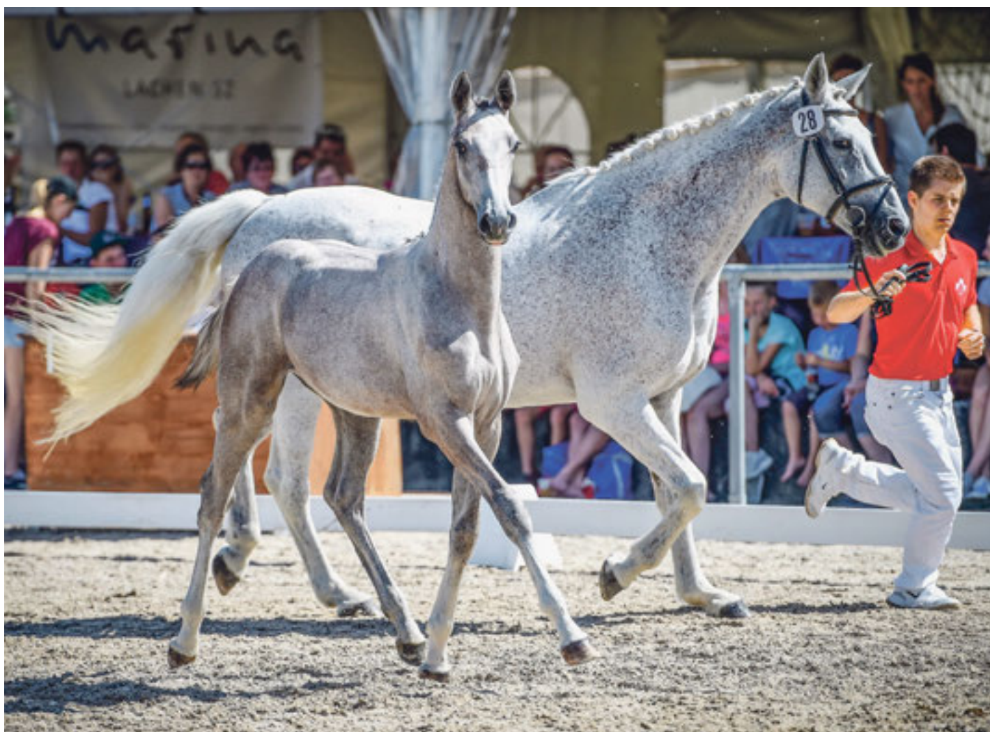
Das Fohlen Zira Blue ZSH.

Fohlen zu investieren, in der Hoffnung, in Zukunft gute Schweizer Sportpferde ausbilden zu können.