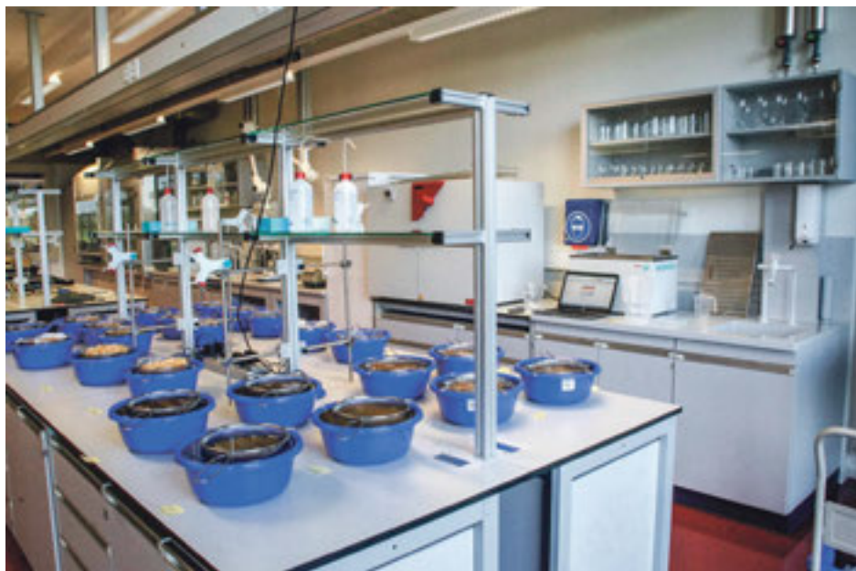
Test zur Überprüfung der Saugfähigkeit von Einstreu im Labor.

Einstreueigenschaften wie Saugfähigkeit, Fressverhalten, Mistmenge, Kosten und Arbeitsaufwand wurden als kaufentscheidend für die Einstreuwahl in Pferdehaltungen an einer Marktanalyse der HAFL identifiziert. In einer Studie untersuchte die HAFL verschiedene Einstreumaterialien, um Unterschiede in Bezug auf oben genannte Kriterien sowie das Liegeverhalten zu objektivieren. In einem sechswöchigen Praxisversuch in einer Pferdehaltung mit 5 Boxen wurden Strohpellets, Hobelspäne und Langstroh getestet. Zusätzlich wurde die Saugfähigkeit (gebundenes Wasser in Gramm nach 2 und 24 Stunden) von 30 verschiedenen Einstreuprodukten unter standardisierten Laborbedingungen analysiert.