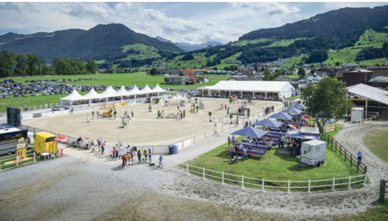
L'installation à Galgenen.