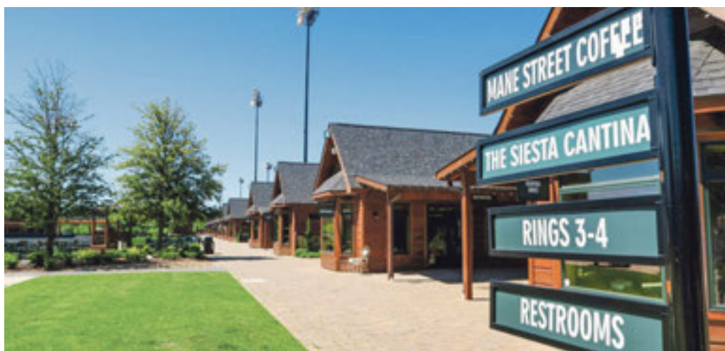
Auch für die Zweibeiner ist gesorgt.