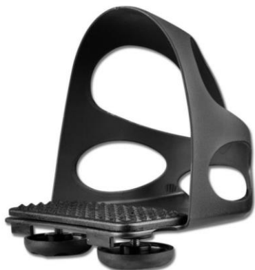
anti-glisse pour étriers noir ou coloré en plastique solide

L'anti-glisse pour étriers illustré ci-dessous est autorisé pour la reprise avec accompagnatrice ou accompagnateur et pour la compétition équestre simple lors de la Journée de la jeunesse.