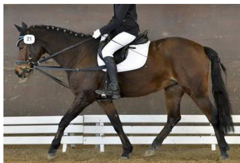
Enrênement fixe à trois points