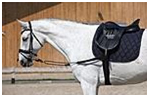
Rênes latérales fixes avec poulie de gui- dage