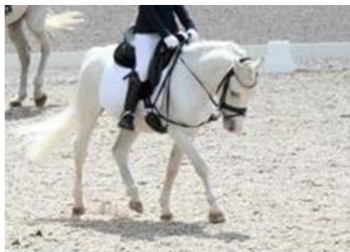
Rênes latérales fixes (Avec/sans anneaux en caoutchouc/ nœuds coulants ou bien intégralement en caoutchouc autorisés)

Le matériau des rênes est secondaire (cuire, caoutchouc, plastique).