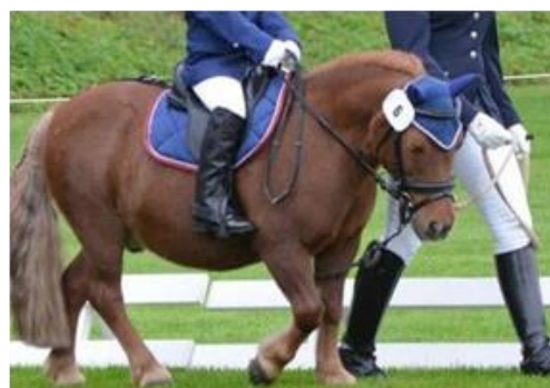
Enrênement fixe avec courroie d'attache à deux points