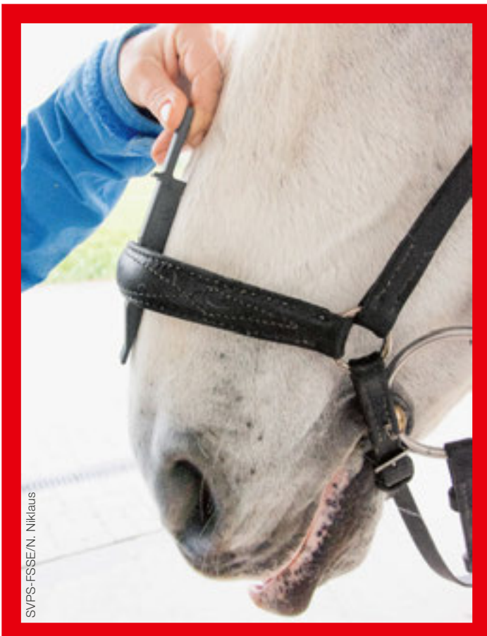
Zu eng verschnalltes hannoveranisches Nasenband Muserolle hanovrienne trop serrée

L'instrument de mesure est inséré entre le chanfrein et la muserolle – ainsi que la sous-barbe s'il y en a une – depuis le haut dans le sens du poil. L'instrument doit pouvoir être inséré jusqu'à la marque «1,5 cm». Une légère pression peut être appliquée pour ce faire. Chez les chevaux peureux, il est recommandé d'insérer l'instrument depuis le bas afin qu'il puisse être retiré plus facilement. La mesure se fait les rênes relâchées.