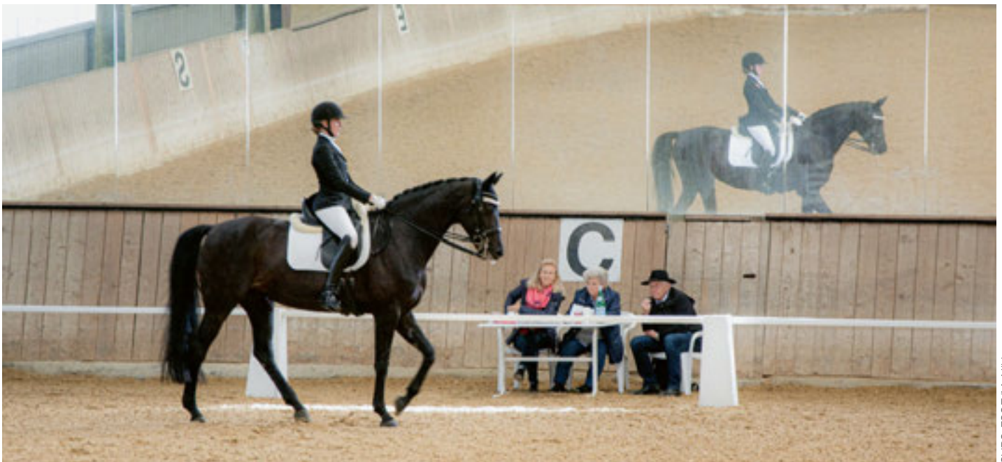
Beim Sichtungsreiten beurteilen die von der Nachwuchsförderungskommission der jeweiligen Disziplin bestimmten Personen die Leistungen und das Potenzial der Nachwuchsreiterinnen und -reiter.

Bien que les sports équestres soient un cas particulier en ce qui concerne la promotion de talents – c'est des seuls sports dans lequel il est possible de se maintenir au haut niveau mondial même à un âge avancé –, la Fédération Suisse des Sports Equestres (FSSE) s'appuie sur les directives et recommandations pour la reconnaissance et la sélection de talents de Swiss Olympic et de la Haute école fédérale du sport de Macolin (HEFSM). Leur philosophie se base sur l'idée directrice de promouvoir non pas les meilleurs jeunes sportifs actuels, mais les meilleurs sportifs de la relève de demain.