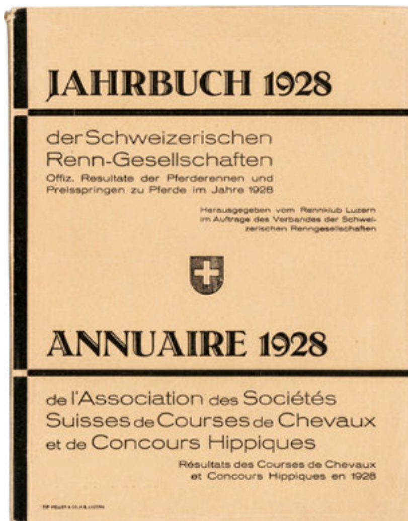
Das Jahrbuch 1928 der Schweizerischen Renn-Gesellschaften

1961 erschien das «Concours-Bulletin» unabhängig vom «Schweizer Kavallerist» bzw. des «Dragon Romand» und erstmals im A5-Format. Jedoch war die Verbandspublication noch weit entfernt vom heutigen Blatt mit Magazincharakter. In den 1960er- und den 1970er-Jahren kam das «Concours-Bulletin» mit bis zu 35-mal jährlich wesentlich häufiger heraus. 1977 war dann Schluss mit so vielen Ausgaben pro Jahr. Während neun Jahren wurde die Anzahl Erscheinungen auf 25 beschränkt. Im Jahr 1986 und bis und mit 1998 kam das «Concours-Bulletin» jeweils 20-mal jährlich in den Druck. Aber nicht nur die Anzahl Ausgaben pro Jahr veränderte sich, auch der Preis musste den Entwicklungen in der Papier- und Druckereibranche nachgehen und entsprechend angepasst werden. Zur Geburtsstunde kostete ein Jahresabonnement noch 10 Franken. Dieser Preis stieg schrittweise immer wieder mal an bis das Heft mit 16 Ausgaben im Jahr 1998 51 Franken kostete.