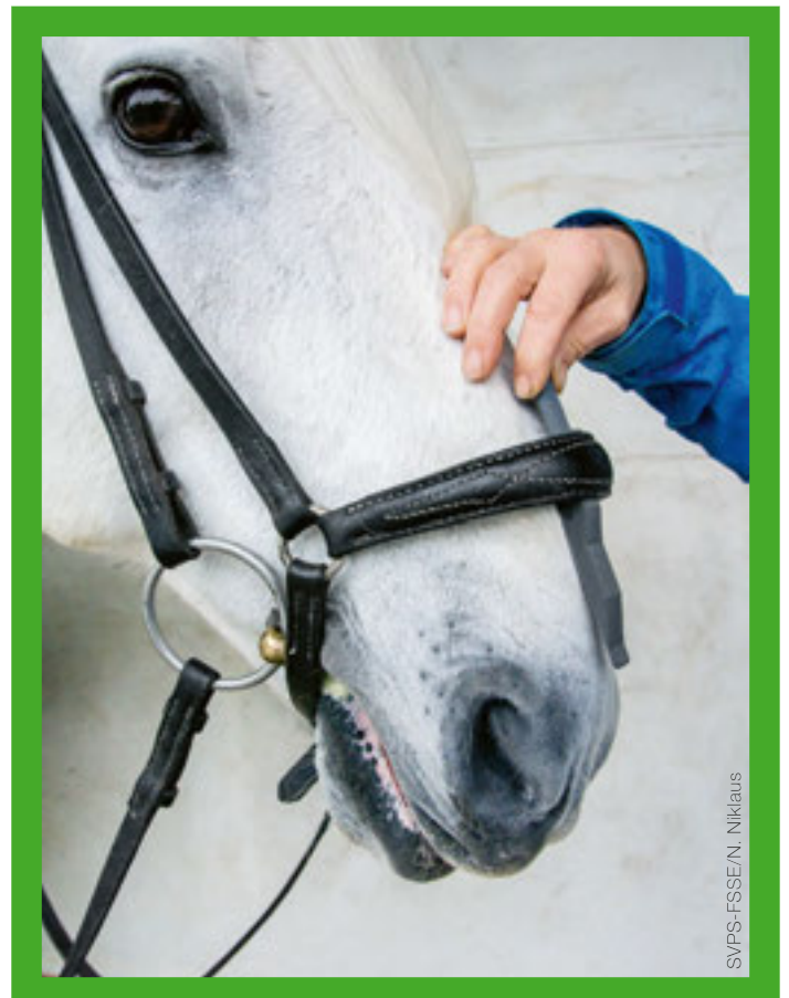
Korrekte Verschnallung eines hannoveranischen Nasenbandes Fixation correcte d'une muserolle hanovrienne