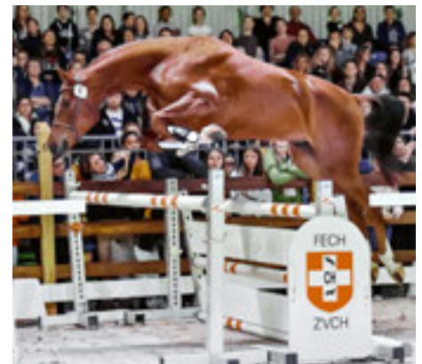
B.M. Hilton – erneut der 2. Rang im Freispringen. B.M. Hilton – 2 e rang au saut en liberté