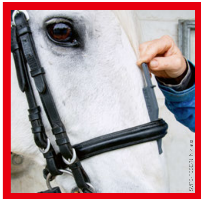
Das Messinstrument lässt sich nicht bis zum Anschlag einführen, das Nasenband der Kandare muss gelockert werden.

Si le contrôle est effectué avant le départ et que le cavalier se montre coopératif après les explications et qu'il ajuste la muserolle, l'officiel fera une note correspondante dans le rapport du jury, cependant sans mentionner le nom du cavalier. Cette note servira exclusivement à des buts statistiques et le cavalier peut prendre le départ dans l'épreuve. En revanche, si le cavalier se montre incompréhensif et qu'il refuse de coopérer, l'officiel fera non seulement une note – toujours sans mentionner de nom – dans le rapport du jury, mais prononcera égale-