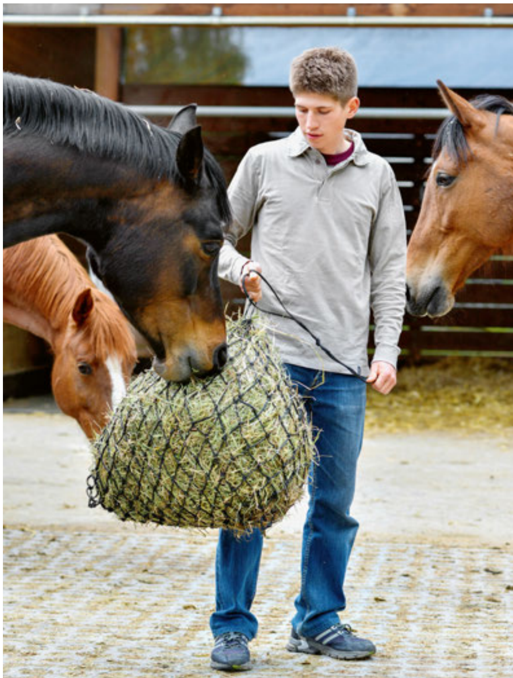
Heunetz zur Heuaufnahme parat. Filet de foin prêt à la consommation