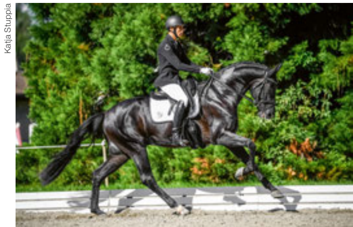
Eine der Stärken von Fürst Alexander TM CH – der Galopp! Un des atouts de Fürst Alexander TM CH – le galop!

Wir wünschen unserem Repräsentanten in Verden viel Erfolg und drücken die Daumen!