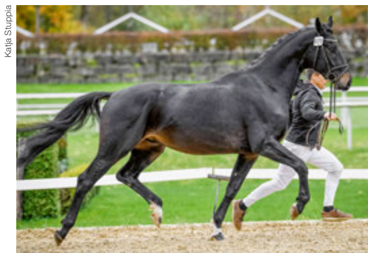
TH Dolcetto CH – 1. Rang ex. in den Grundgangarten TH Dolcetto CH – 1er rang ex. des allures de base