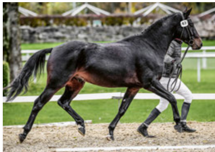
Escaro von Ryfenstein CH – überlegen im Freispringen Escaro von Ryfenstein CH – En tête du saut en liberté